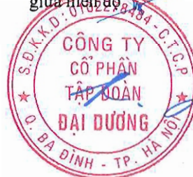
Mai Hữu Đạt

Thông qua phát hành Báo cáo tài chính riêng giữa niên độ.